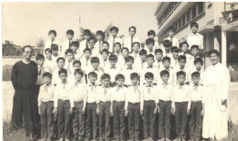
Lớp Gabriels, bức ảnh này được chụp năm 1972 tại An Phong Học Viện, Thủ Đức, Việt Nam

Xin Chúa thương che chở và ban bình an cho thế hệ lãng quên.